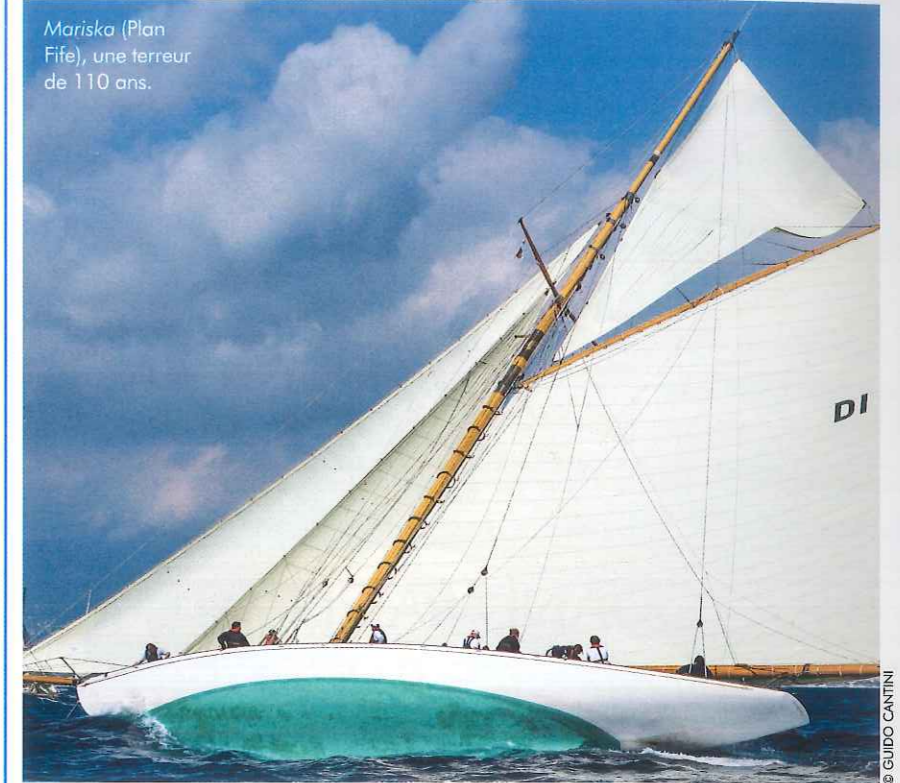
Mariska (Plan Fife), une terreur de 110 ans.